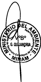
Manuel Pulgar-Vidal Otálora Ministro del Ambiente