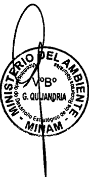
Manuel Pulgar-Vidal Otálora Ministro del Ambiente