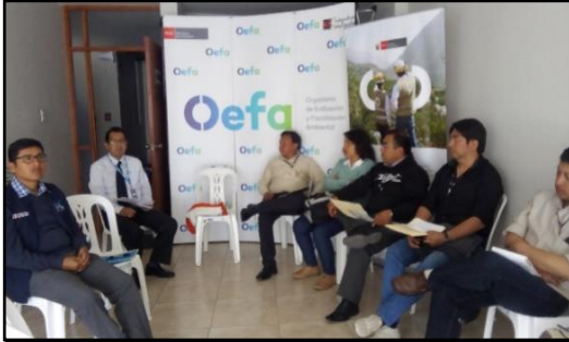
10 de agosto. Cajamarca

Recuperación Ambiental del Lago Titicaca; y, en el segundo caso, a través del seguimiento del Grupo Técnico Purús Frontera Viva y Desarrollo Sostenible (instancia que a su vez coadyuva en la implementación del Plan de Acción Directa de la provincia de Purús y los distritos de Yurúa y Tamaya).