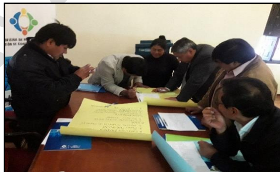
23 de abril. Ayacucho