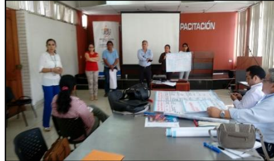
10 de abril. La Libertad